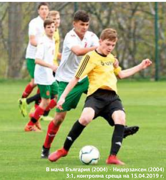
В мача България (2004) - Нидерланд (2004) 3:1, контролна среща на 15.04.2019 г.

пред такива фенове само на 15 години е много хубаво нещо.