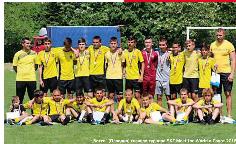
„Ботев“ (Пловдив) спечели турнира SKF Meet the World в Сопот 2018

На „Купа Готия“ пловдивският отбор записа исторически финал, който загуби с 0:4 от ФК „Лизи“ от Гана. Преди това „канарчетата“ изиграха 10 мача. По пътя до финала Ботев преодоля отбори от Швеция, Хонконг, САЩ, Норвегия, Бразилия и Франция.