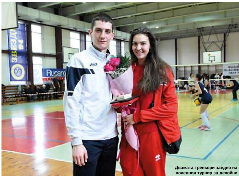
Двамата треньори заедно на коледния турнир за девойки

Текст: Ани Колева