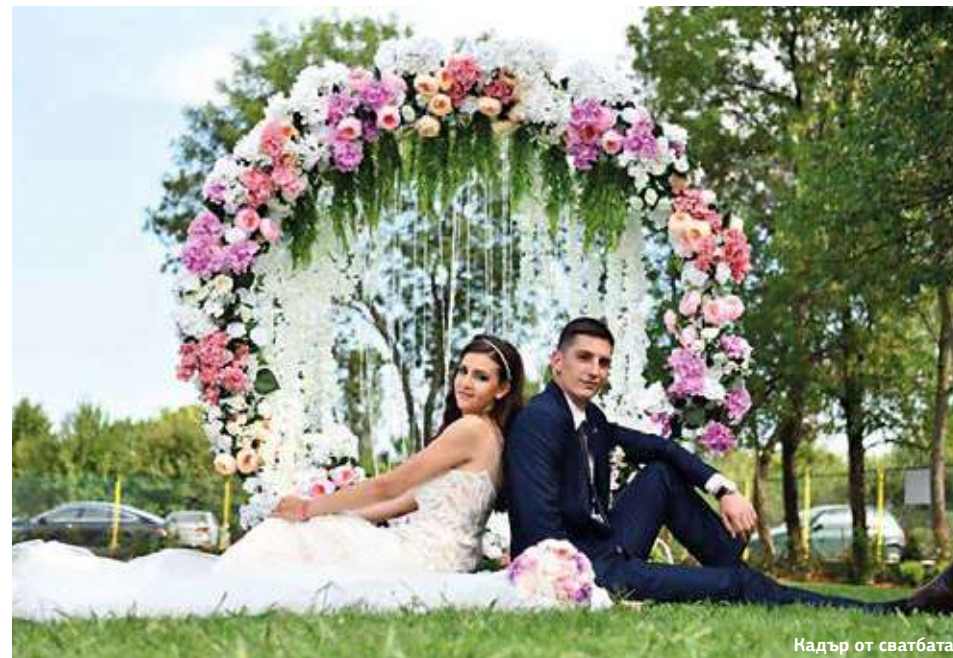
Кадър от сватбата