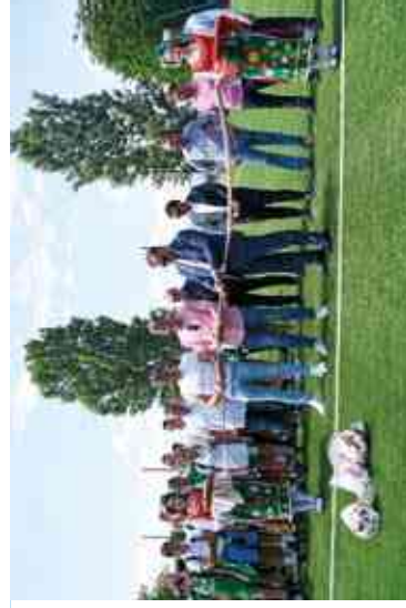
Част от модерната футболна база и момент от откриването ѝ