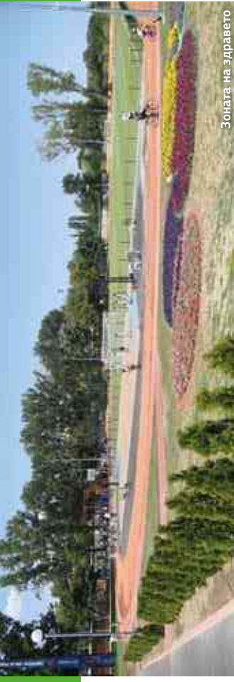
Зоната на здравето