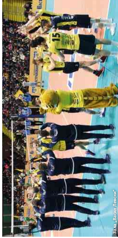
Зала „Васил Левски“

Сериозният налив от тренировки в града доведе до решението да бъде построена чисто нова зала в двора на Спортното училище. Тя ще бъде учебно-тренировъчна, като вече бе направена първа копка. Капацитетът е 200 души. Там ще се провеждат състезания по различни спортове и ще се използва за всички ученически мероприятия. В нея ще бъдат настанени голяма част от спортните клубове, които през зимата тренираг във физкультурни салони, което създава неудобства. Проектираната сграда ще бъде на един етаж, на който ще са разположени физкультурен салон, съблекални за мъже, жени и хора в неравностойно положение, помещения с душове, общи помещения и фитнес зала. В момента в района на зала