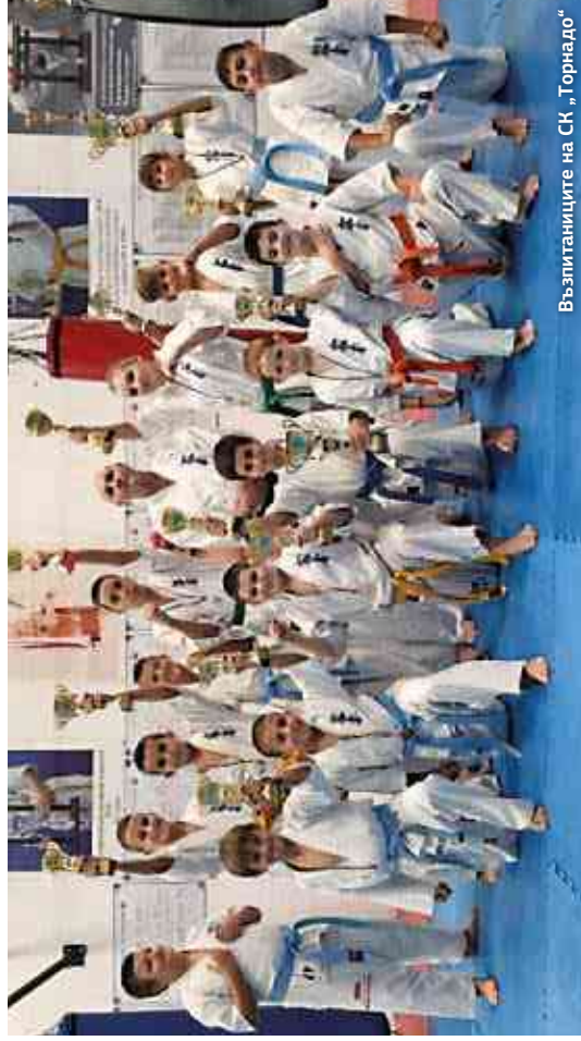
Възпитаниците на СК „Горнадо“

От 2021 година стартира уникално намаление на налози в Пазарджик за картотекиран подрастващ състезател в семейството