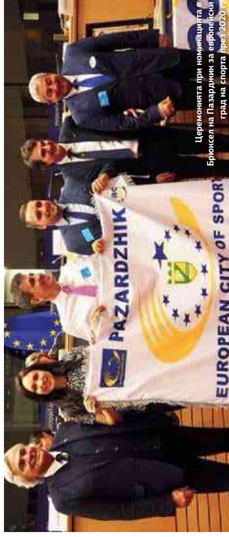
Церемонията при номинацията в Брюксел на Пазарджик за европейски град на спорта през 2020 г.