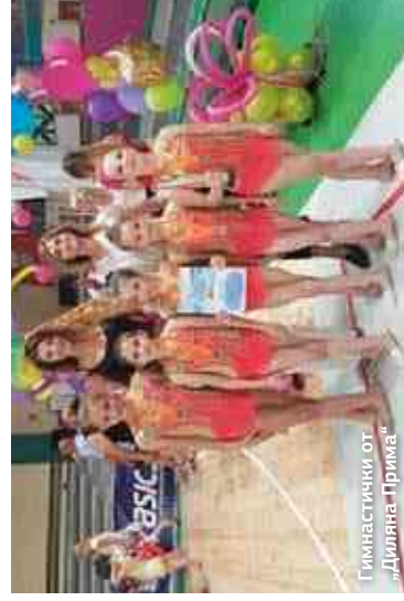
Гимнастици от „Дилиана Прима“