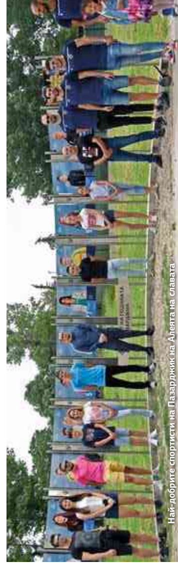
Най-добрите спортисти на Пазарджик на Алеята на слава