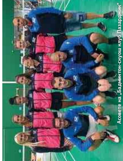
Асовете на „Бадминтон-скуош клуб Пазарджик“