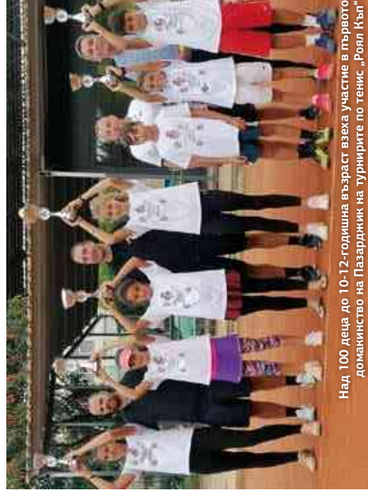
Над 100 деца до 10-12-годишна възраст взеха участие в първото домакинство на Пазарджик на турнирите по тенис „Роял Къп“