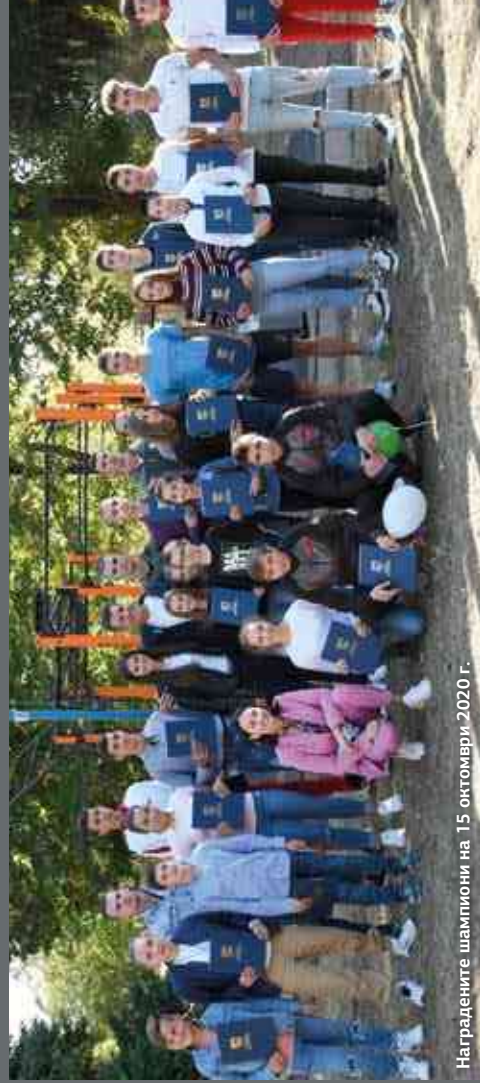
Наградените шампиони на 15 октомври 2020 г.

За наградите. Много хубаво беше, когато наскоро наградахме 35 деца по 10 вида спорт – шампиони. Само за два месеца 35 държавни шампиони... Няколко дни по-късно наградахме още петима. Това е атестат за нашата работа. Сигурен съм, че тази година ще имаме над 1500 медала. Няма как да награждаваме всички обаче, а само победителите. Става така, защото рано или късно това, което сме правили през годините, започва да дава плодове. Заради сложната 2020 г. ще запазим титлата „Европейски град на спорта“ и през следващата година.