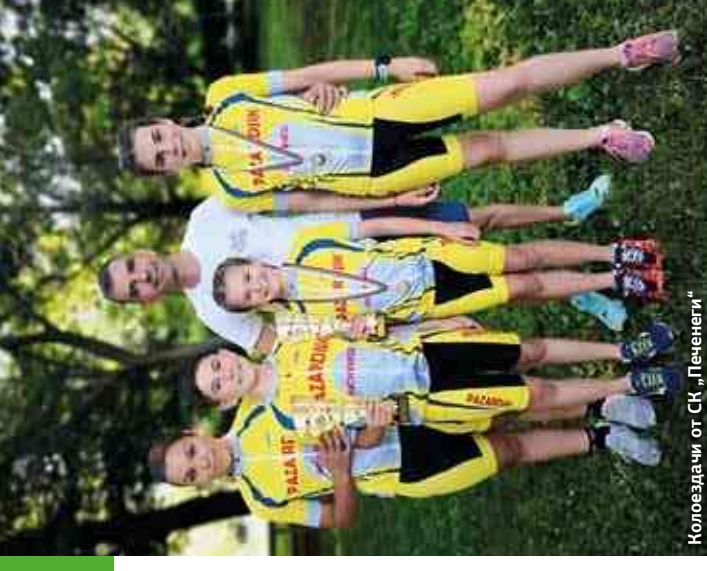
Колонздачи от СК „Печенеги“

Вече е в ход и се обмисля следващата идея – планира се от 2022 г. да има намаление на данъците и за семействата на децата, които се занимават активно с дейности на културата. Как точно ще стане това обаче още е рано да се каже.