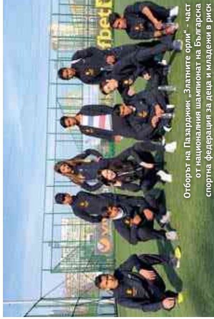
Отборът на Пазарджик „Златните орли“ - част от националния шампионат на Българска спортна федерация за деца и младежи в риск