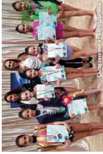
Състезатели от клуб „Дилиана“

стана вицешампионка на Държавното първенство в категория „Елит“ за девойки младша възраст в края на август, като добави и четири сребърни медала на отделните уреди.