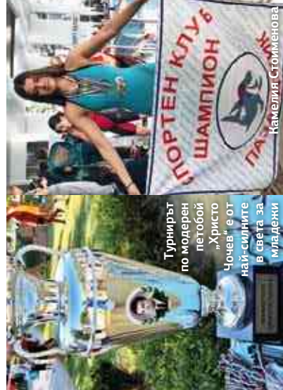
Турнирът по модерен петобой „Христо Чочев“ е от най-силните в света за младежи

Плуването е важната връзка за още два олимпийски спорта, които са приоритетни за Пазарджик – модерен петобой и триатлон. Общо шест клуба водят подготовка на 25-метровия басейн „Христо Чочев“, кръстен на емблематичната фигура,